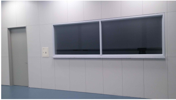
외부(출입문 1개, 폐쇄창 1개)