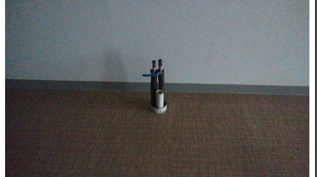
수전 및 배수구