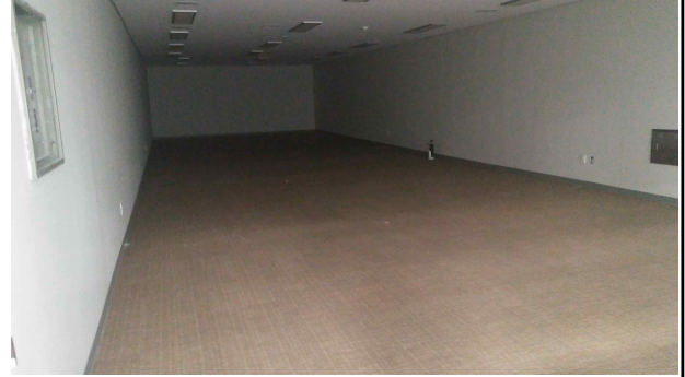
출입문쪽에서 본 사무실 내부