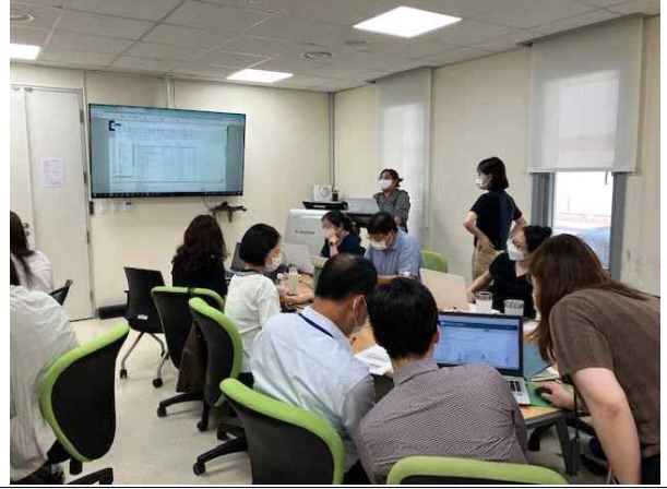
질병진단 요점 교육